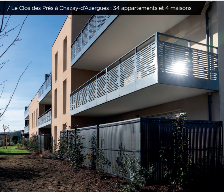
/ Le Clos des Prés à Chazay-d'Azergues : 34 appartements et 4 maisons